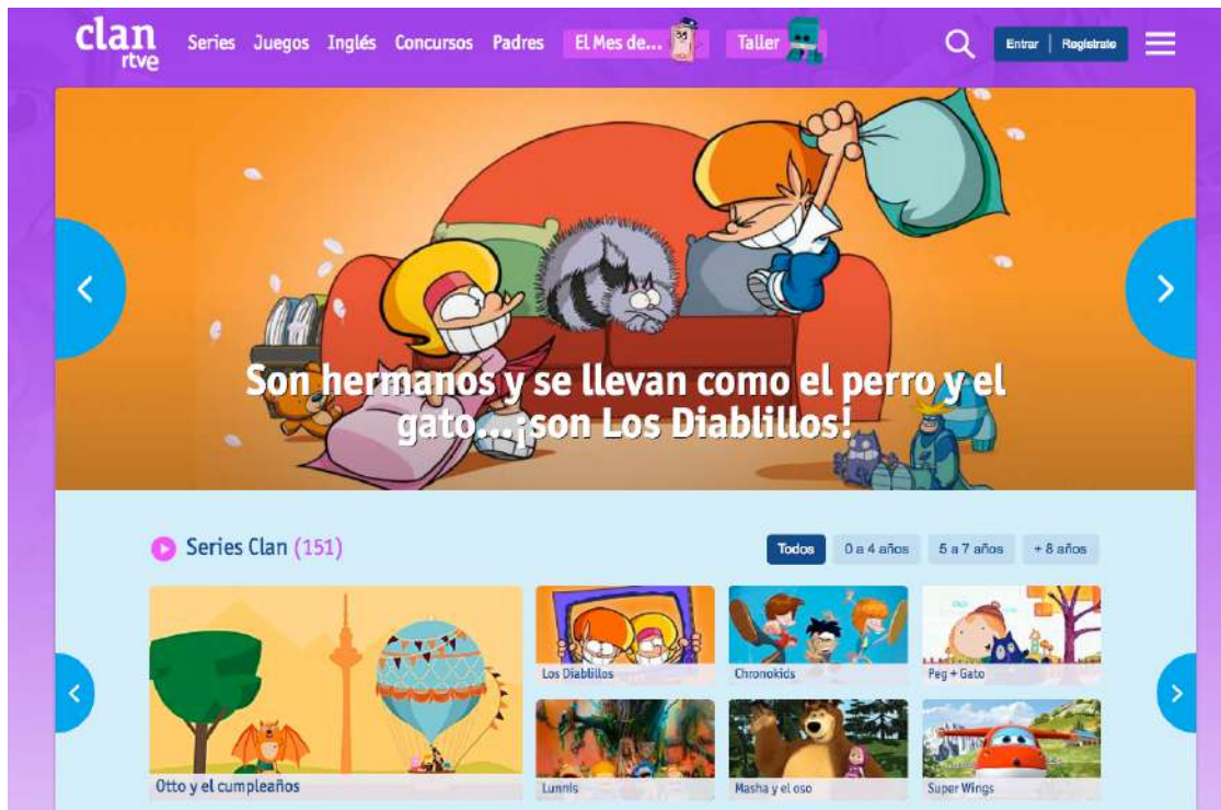
Clan classifica els seus continguts per edats